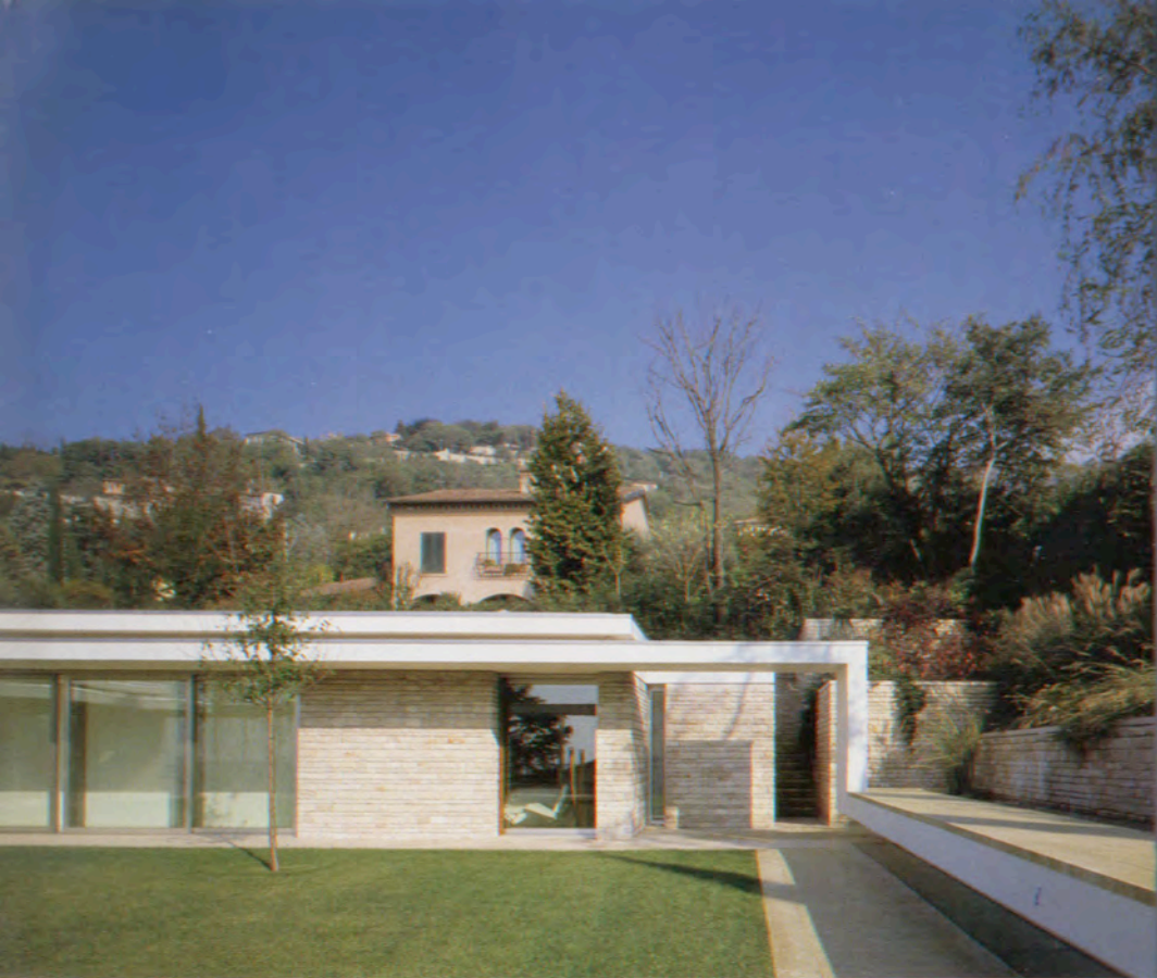
CAMILLO BOTTICINI / FRANCO SANGALLI CÀSA EN "RONCHI" / HOUSE IN "RONCHI" BRESCIA, ITALIA / ITALY