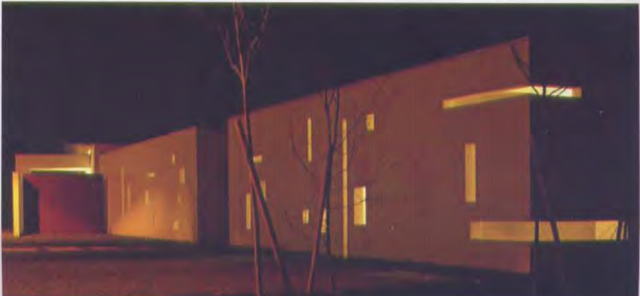
W INSIDE ETERY WITH AL VAULTS TUARY IN THE UND. BOTTOM ST FRONT WITH ATE CHAPELS. AGE, BOTTOM, IDE THE CEME- TH THE PRIVATE NEXT TO THE VAULTS.

sospensione temporale che esprime e interpreta con grande profondità un luogo 'difficile' per i caratteri di istituzionalità e intima individualità cui si relaziona. CAMILLO BOTTICINI